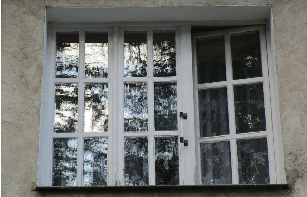
Foto 3 Widok na jedno ze starych okien przeznaczonych do wymiany

W budynku podczas wcześniejszych prac remontowych w częściach mieszkalnych wymieniono stolarkę okienną na nową w kolorze białym. Obecnie projektuje się wymianę czterech starych drewnianych okien w lokalu mieszkalnym nr 18. Okna nie posiadają ozdób, parapet wewnętrzny drewniany zaś zewnętrzny z blachy cynkowanej surowej. Wszystkie stare zniszczone drewniane okna w złym stanie technicznym kwalifikujące się do wymiany.