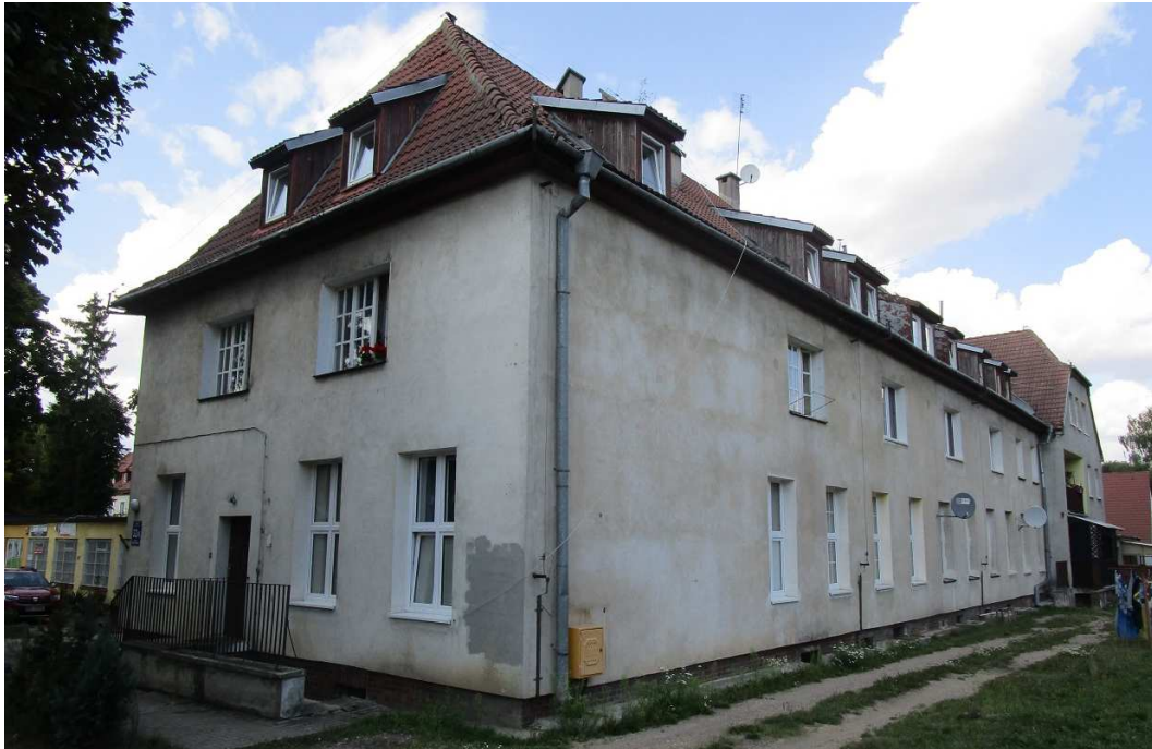
Foto 1 Widok ogólny na elewację

Budynek murowany posiada dwie kondygnacje nadziemne i jedną podziemną oraz poddasze użytkowe. Budynek wzniesiony metodą tradycyjną z cegły ceramicznej w latach 1940 - 44. Dach wielospadowy.