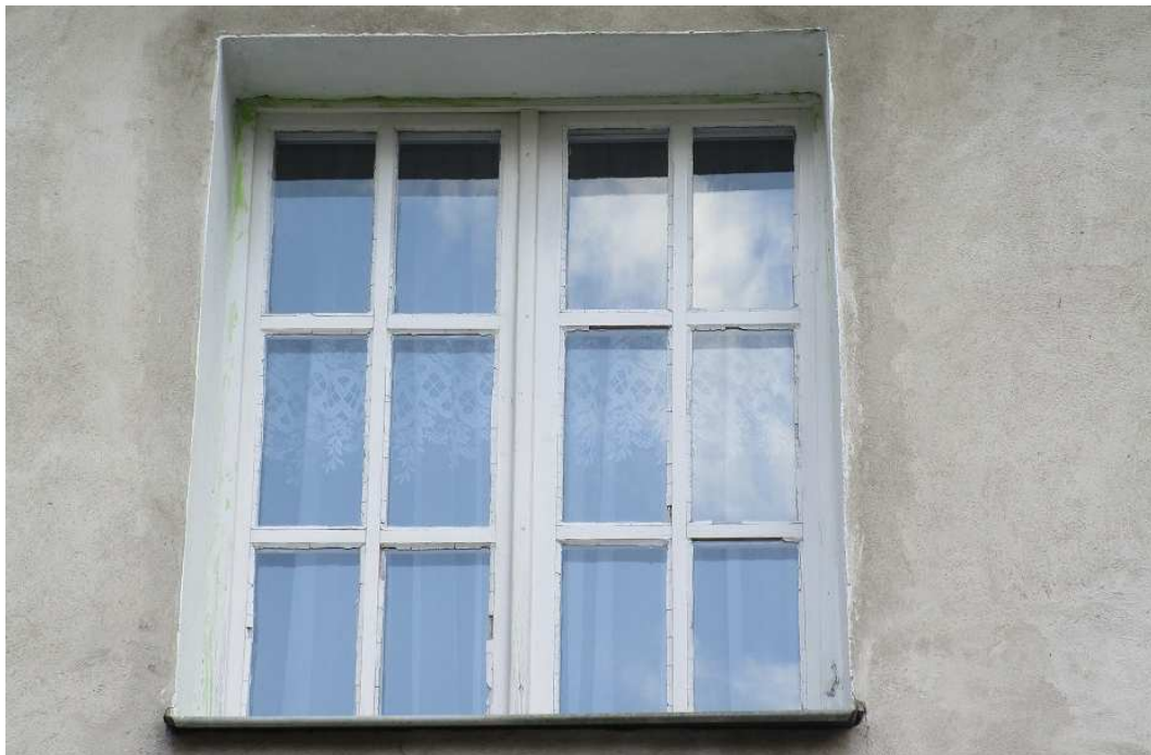
Foto 4 Widok na jedno ze starych okien przeznaczonych do wymiany