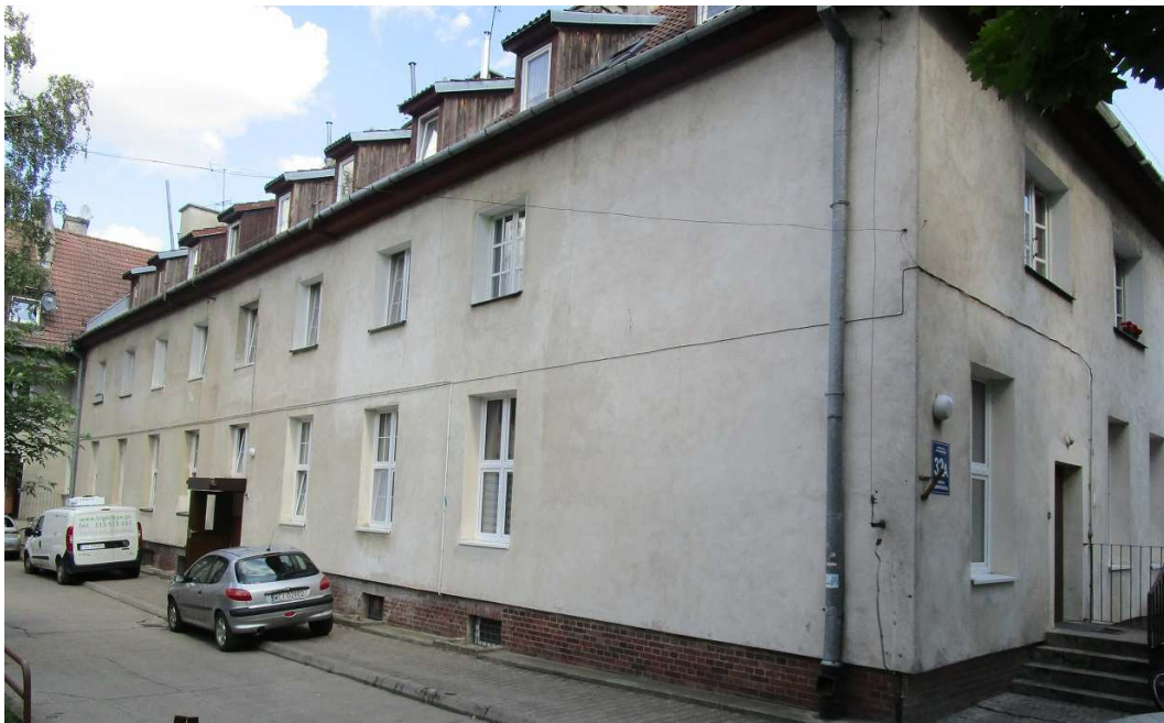
Foto 2 Widok ogólny na elewację